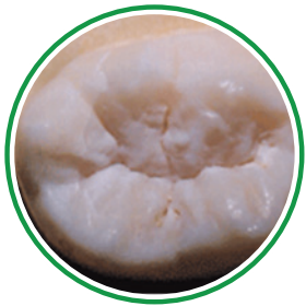
УГЛУБЛЕНИЯ И КАНАВКИ

Зубной силант — жидкое покрытие, которое наносится на жующие поверхности больших коренных зубов с целью предотвращения образования кариозных полостей (дупел). Это покрытие заполняет углубления и канавки зуба, «изолируя» зуб от бактерий и остатков пищи, вызывающих образование кариозных полостей.