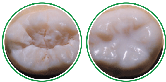
HENDIDURAS Y PLIEGUES

El sellador dental es un revestimiento líquido que se aplica a las superficies que se usan para masticar de las muelas con la finalidad de prevenir la caries. El revestimiento pasa a las hendiduras y pliegues de la muela “sellándola” de modo que las bacterias y los residuos de alimentos entren y provoquen caries.